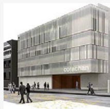
Clínica Corachán (BARCELONA)