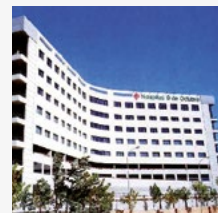
Hospital 9 de Octubre (VALENCIA)