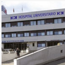
Hospital Madrid Montepríncipe (MADRID)

Cigna pone a su disposición una de las redes de servicios médicos concertados más prestigiosa y extensa , con más de 44.000 profesionales y 1.900 hospitales y clínicas privadas en España.