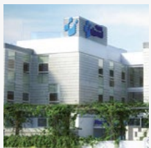
Hospital Viamed Santa Ángela de la Cruz (SEVILLA)

Para más detalle consulta el Cuadro Médico en nuestra web: