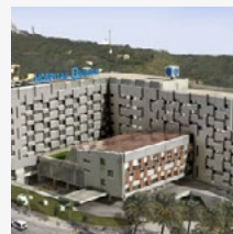
Hospital Quirón (BARCELONA)