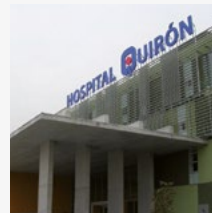
Hospital Quirón (MADRID)