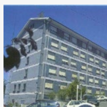
Clínica Virgen Blanca (BILBAO)