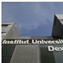
Institut Dexeus (BARCELONA)