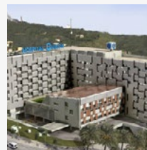
Hospital Quirón (BARCELONA)