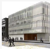
Clínica Corachán (BARCELONA)