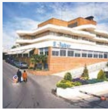
Hospital Ruber Internacional (MADRID)

Cigna pone a su disposición una de las redes de servicios médicos concertados más prestigiosa y extensa , con más de 41.900 profesionales y 1.870 hospitales y clínicas privadas en España.