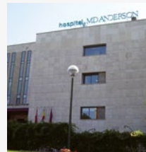
Hospital MD Anderson (MADRID)