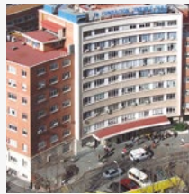
Fundación Jiménez Díaz (MADRID)