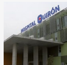
Hospital Quirón (MADRID)